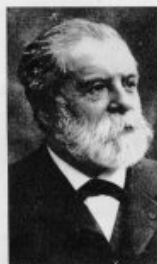
Etienne-Jules Marey, (1830-1904). Médecin et physiologiste français, professeur d'histoire naturelle au Collège de France dès 1867, il fut un scientifique de renom. Il n'employa la photographie qu'à partir de 1882, après avoir

L'expérience confirma pleinement ses vues et ses résultats firent grand bruit entre la science « officielle » et ceux qui suivaient avec enthousiasme les travaux de Quinton. Il réussit à imposer sa loi de constance thermique et continua ses recherches, car il sentait qu'il n'avait ouvert qu'une toute petite porte devant les immenses mystères des origines de la vie.